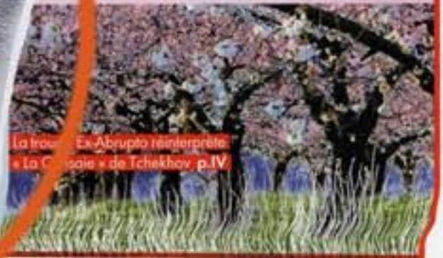
La troupe Ex Abrupto réinterprète « La Cigale » de Tchekhov p.IV