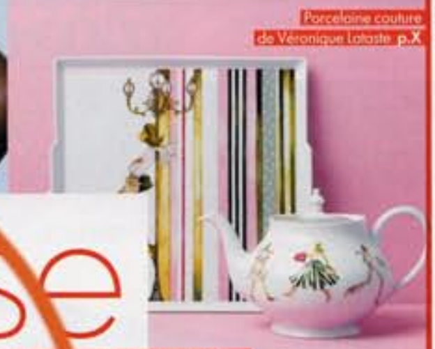
Porcelaine couleur de Véronique Latoste p.X