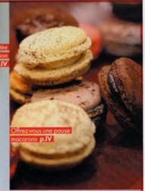
Offrez-vous une pause macarons p.IV